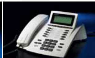
ST 15 (analog), ST 21, ST 31, ST 40, ST 40 IP