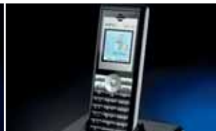
Analog Telefon DECT 20 (AB)