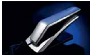
Analoge Telefone T 10/T 15 (eco)

Mehr Informationen auf den Software-Seiten.